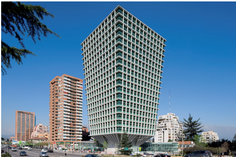
Nº 2: Foto del edificio Cruz del Sur.